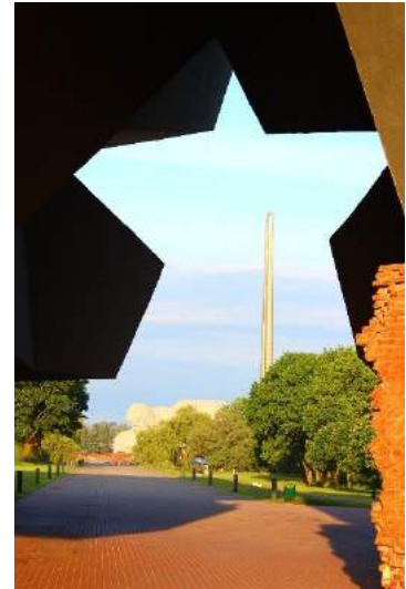
Majestátnosť pamätníka hrdinov druhej svetovej vojny v Brestskej pevnosti v Bielorusku je ohurujúca.