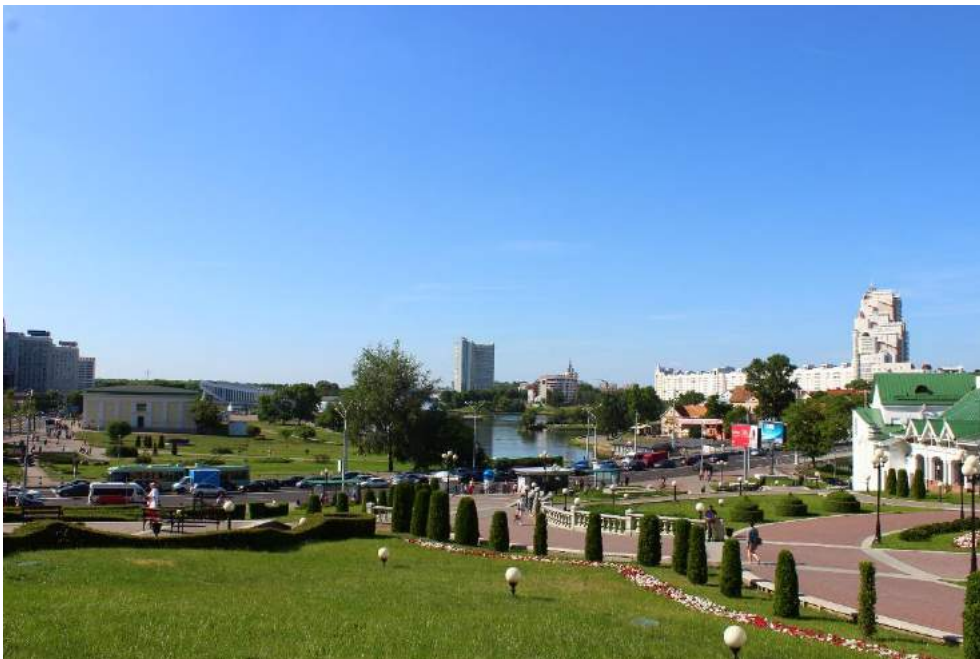
Bieloruská metropola Minsk príjemne prekvapila svojou čistotou a upravenosťou verejných priestorov, hoci na sklonku 2. svetovej vojny bola zničená a historických pamiatok sa v meste zachovalo minimum.